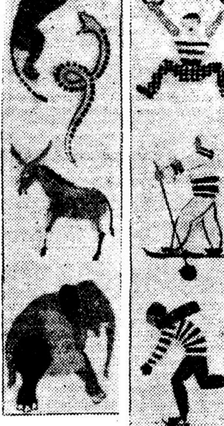
Сверху в центре — эскизы пьесы для фойе Московского театра для детей, слева и справа — эскизы росписи колонн фойе, внизу — эскизы костюмов